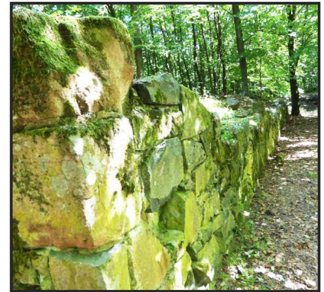
Mauerrest der Burgruine auf der Hardeck

Das Lorbacher Wappen mit dem Hardecker Löwen im Oberteil. Ein goldener, aufsteigender, rot bewehrter und rot bezungter, doppelschwänziger Löwe auf Blau (im Lorbacher Wappen auf rotem Hintergrund)